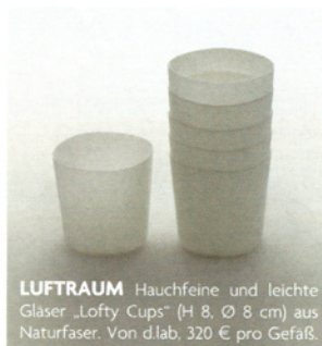
LUFTRAUM Hauchfeine und leichte Gläser „Lofty Cups“ (H 8, Ø 8 cm) aus Naturfaser. Von d.lab, 320 € pro Gefäß.