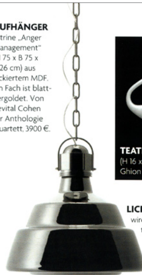
LICHTZAUBER Beim Anschalten wird die verspiegelte Hängeleuchte „Glas Grande“ (H 41, Ø 41 cm) durchsichtig. Eine Kooperation von Diesel mit Foscarini, 500 €.