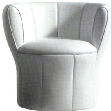
LADYLIKE Sessel „Lisa“ (H 72 x B 73 x T 66,5 cm) in weißem Leder, auch in bordeauxfarbenem und schwarzem Samt. Von Laudani & Romanelli für Driade, 1365 €.

in Stuttgart. Unter dem Motto „Tischkultur-Avantgarde“ werden edle Tafelservice und beeindruckende Objekte präsentiert. hering-berlin.de .