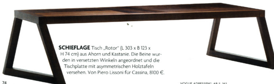
SCHIEFLAGE Tisch „Rotor“ (L 303 x B 123 x H 74 cm) aus Ahorn und Kastanie. Die Beine wurden in versetzten Winkeln angeordnet und die Tischplatte mit asymmetrischen Holztafeln versehen. Von Piero Lissoni für Cassina, 8100 €.

Den Stuhl „Venus“ (H 88 x B 53 x T 63 cm) gibt es ab jetzt auch mit gepolstertem Lederbezug. Konstantin Grcic für Classicon, 1290 €.