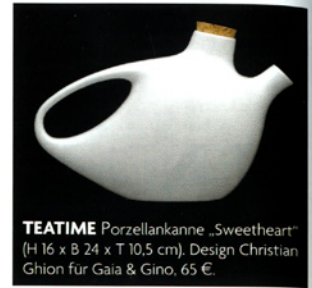
TEATIME Porzellankanne „Sweetheart“ (H 16 x B 24 x T 10,5 cm), Design Christian Ghion für Gaia & Gino, 65 €.

Vitrine „Anger Management“ (H 75 x B 75 x T 26 cm) aus lackiertem MDF. Ein Fach ist blattvergoldet. Von Revital Cohen für Anthologie Quartett. 3900 €.