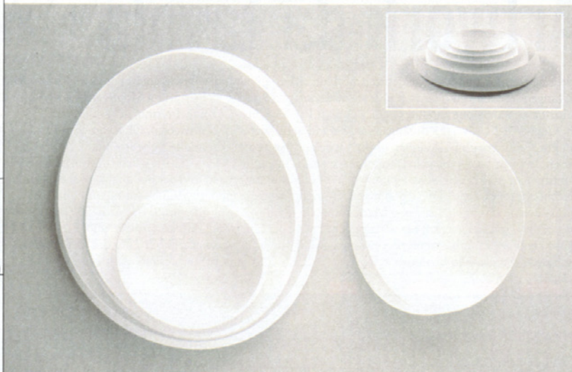
Effetto minimal-organico per le ciotole porta-frutta "Soft Bowls", di polvere di nylon bianco. Le forme irregolari e i bordi svasati consentono di creare composizioni sempre diverse.